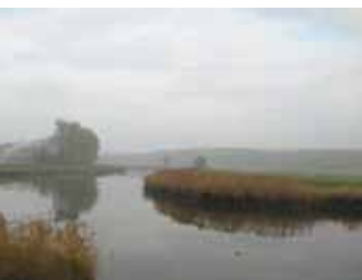
Störschleife bei Itzehoe

Eine Veranstaltung der Akademie Sankelmark