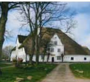
Roter Haubarg