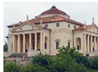
Palladios Villa Rotonda

Eine Veranstaltung der Akademie Sankelmark