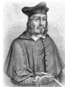
Angelus Silesius

Das Seminar bietet eine Einführung in die Meditation, aber auch die Möglichkeit, die Meditation intensiv zu praktizieren. Es widmet sich zudem den Gedichten des Barockdichters Angelus Silesius (1624 - 1677). In ihnen hat Silesius spirituelle und mystische Erfahrungen festgehalten. Sie eignen sich durch ihre knappe, bildhafte, oft paradox formulierende Sprache für die Begleitung und Klärung der inneren Prozesse, die sich während der Meditation abspielen. Zur theoretischen Einführung in die Meditation und zur Meditationspraxis kommen leichte Körperübungen (Hatha-Yoga) hinzu. Sie helfen mit, in die Stille zu finden.