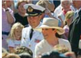
Das dänische Prinzenpaar

Eine Veranstaltung der Europäischen Akademie Schleswig-Holstein