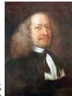
Adam Olearius, Gelehrter und Diplomat in Persien

Eine Veranstaltung der Europäischen Akademie Schleswig-Holstein