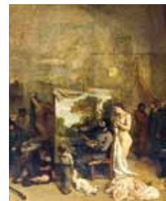
Gustave Courbet: „Das Atelier“ (Ausschnitt)

Eine Veranstaltung der Akademie Sankelmark