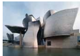
Das Guggenheim-Museum in Bilbao