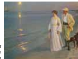
Peder Severin Krøyer mit seiner Frau am Strand von Skagen

Eine Veranstaltung der Europäischen Akademie Schleswig-Holstein