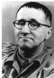
Bertolt Brecht

Er sei der größte Lyriker des 20. Jahrhunderts gewesen, hat man gesagt. Und manche meinen, dass Brechts Gedichte länger leben werden als seine anderen Schriften. Die Tagung führt ein in die frühen Augsburger Liebesgedichte, stellt die Svendborger Gedichte aus dem Exil vor und behandelt die späten Gedichte nach dem 17. Juni 1953. Sie betrachtet Brechts Lyrik als Teil seines Gesamtwerkes und würdigt ihn und sein Schaffen in seiner Zeit.