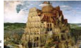
Pieter Bruegel d. Ä., Turmbau zu Babel

Eine Veranstaltung der Akademie Sankelmark