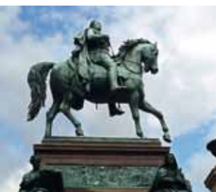
Reiterstandbild Friedrich Wilhelm IV. vor der Alten Nationalgalerie in Berlin

Eine Veranstaltung der Europäischen Akademie Schleswig-Holstein