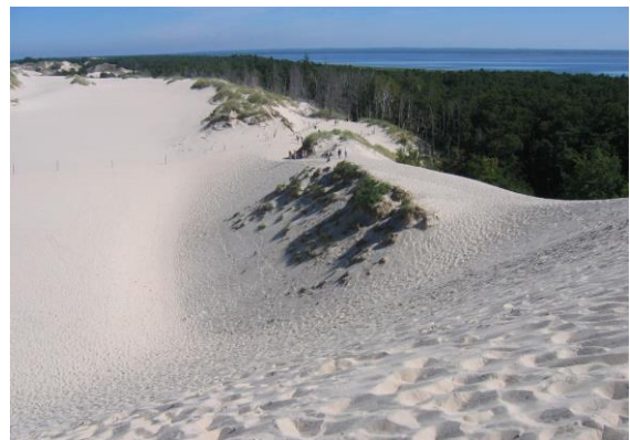
Slowinzischer Nationalpark.

Um 13.00 Uhr weiter nach Schmolsin/Smółdzino und Aufstieg auf den 115 m hohen Revekol/Rowokół, der Pechstein und Schmidt-Rottluff zu vielen Werken inspiriert hat. Anschließend zurück nach Leba und Gelegenheit für einen Strandspaziergang zum 1907 erbauten Hotel Neptun auf der Düne am Strand. Abendessen im Hotel.